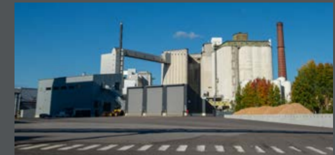
Smart Chemistry Park Raisiossa tukee tutkimuslähtöistä yritysyhteistyötä ja pk-yritysten kasvua.